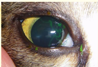
ネコヘルペスウイルスによる角膜炎 (フルオレセイン染色)

このお薬は猫ヘルペスウイルスによる 様々な眼科的症状を軽減させる目薬です。 ネコちゃんの充血や目やになどの 目の症状をやわらげます。