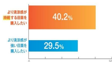
（2014年5月千寿調査より、クールタイプCL用目薬ユーザー n=1,256）