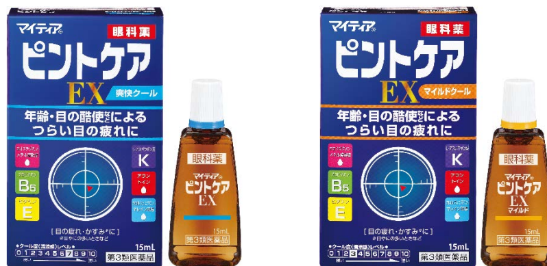
マイティアピントケアEX