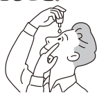
容器の先が目、まぶた、まつ毛にふれないように