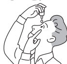
容器の先が目、まぶた、まつ毛にふれないように